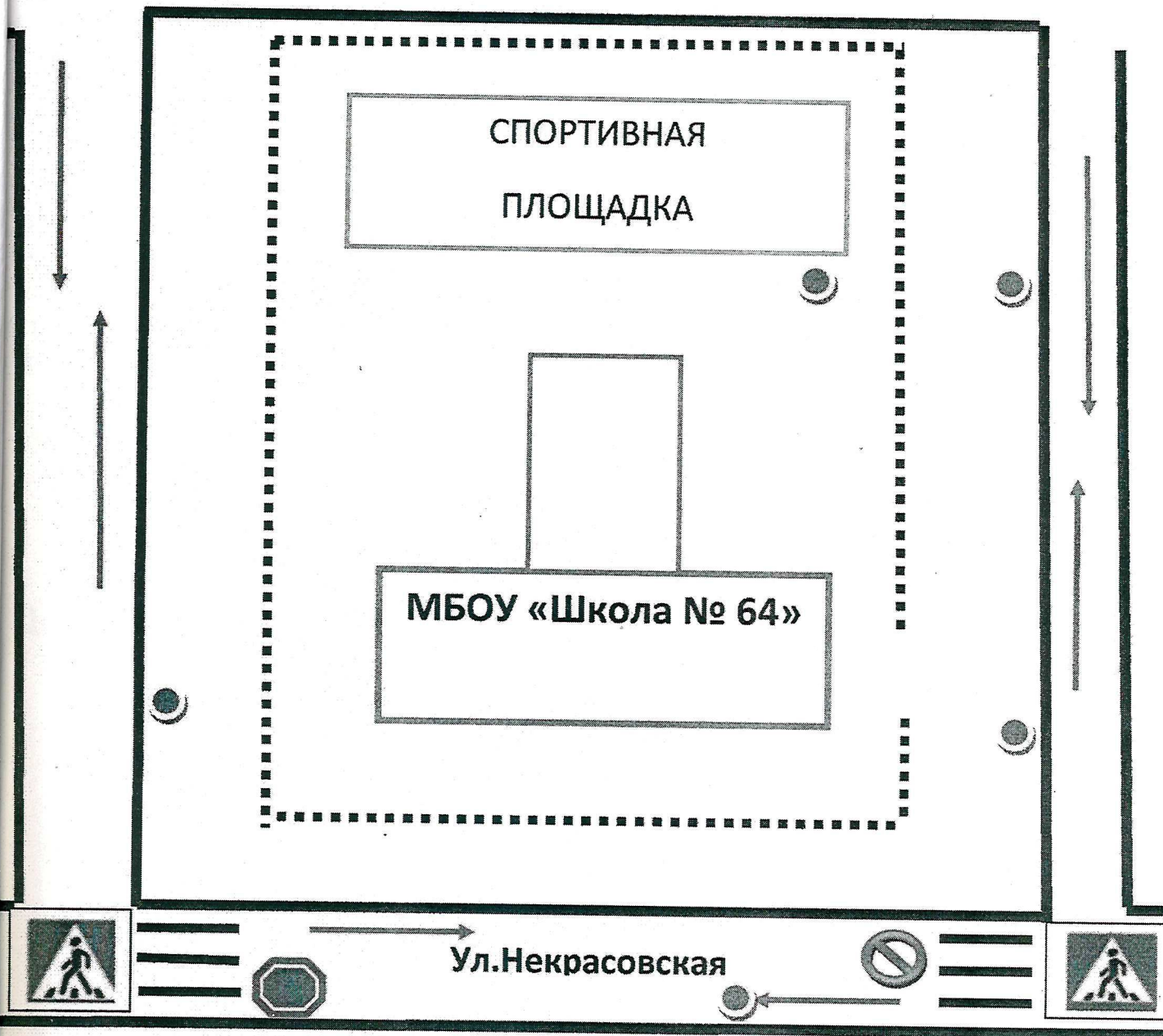
Схема организации дорожного движения в непосредственной близости от образовательного учреждения с размещением соответствующих технических средств, маршруты движения детей и расположение парковочных мест.